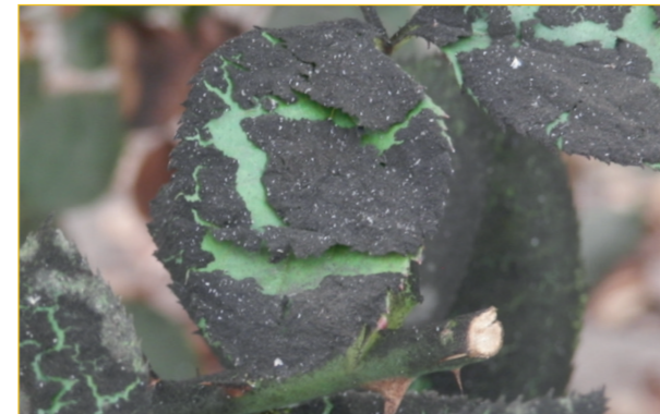
Zichtbare afbraak van roetdauw na een behandeling met OROGANIC .

Mocht er honigdauw of roetdauw aanwezig zijn, dan zorgt OROGANIC ervoor dat dit stopt, indroogt en lossen zal komen te zitten op de vruchten.