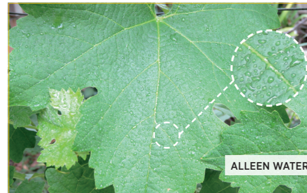
Blad behandeld met alleen water. Deze foto toont duidelijk druppels op het bladoppervlak.

De effecten op nuttige insecten vindt u verderop in deze folder.