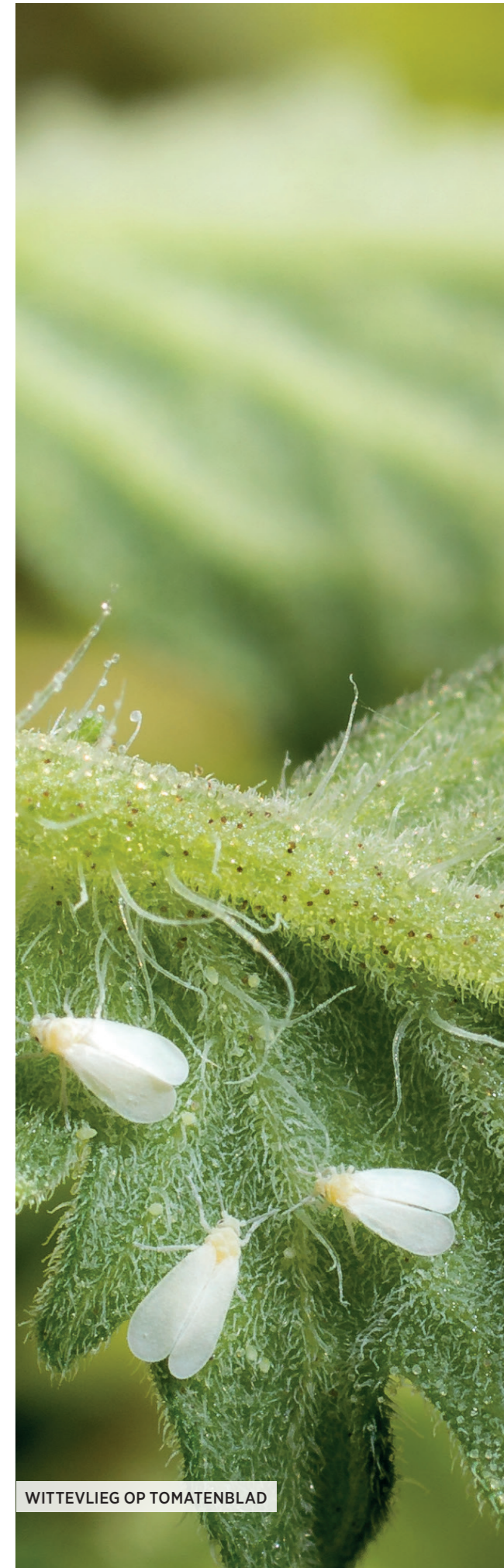
WITTEVLIEG OP TOMATENBLAD

OROGANIC in het spuitsysteem heeft een reinigende werking. Zorg ervoor dat uw apparatuur goed schoon is, om schade door oplossen van stoffen uit vorige bespuitingen te voorkomen.