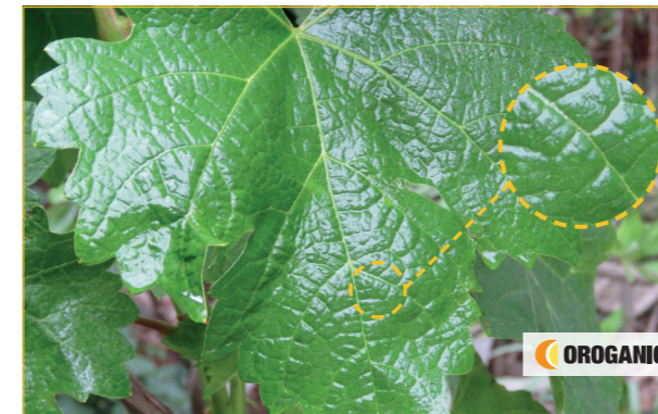
Het bespuiten van een gewas met OROGANIC verbetert de bedekking op bladeren en vruchten aanzienlijk.

Zoals bekend kunnen insecten een resistentie ontwikkelen voor chemische stoffen. Het voorkomen en bestrijden van resistentie is dan ook onderdeel van de keuze voor een middel. Door de unieke werking van OROGANIC kan een insect geen resistentie ontwikkelen tegen deze werkzame stof. OROGANIC voorkomt resistentie-opbouw en zorgt er ook voor dat insecten met een resistentie tegen een andere werkzame stof wel aangepakt worden. OROGANIC doorbreekt de resistentie.